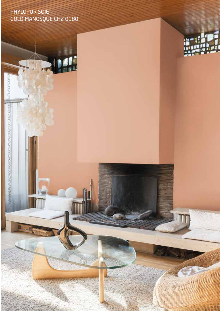
PHYLOPUR SOIE GOLD MANOSQUE CH2 0180